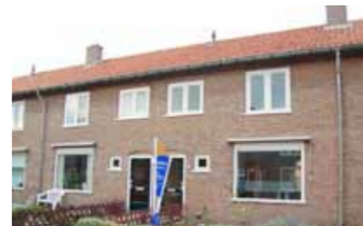
Pamontstraat 21 - Keizerslanden € 134.000,- k.k.