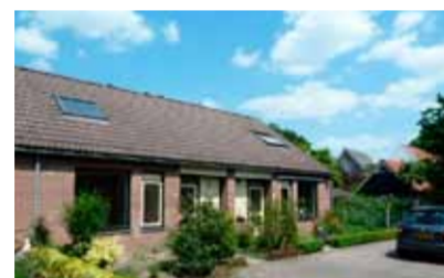
Collegietuin 12 - De Worp € 155.000,- k.k.