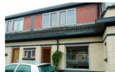
J.F. Gronoviusstraat 26 - Zandweerd-Zuid € 119.000,- k.k.