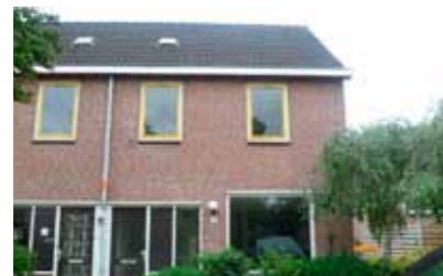
J.D. Huijbersstraat 13 - Zandweerd € 154.000,- k.k.