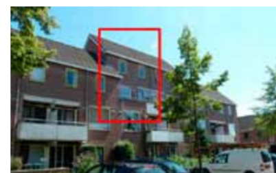
J. Strieningstraat 36 - nabij centrum € 115.000,- k.k.