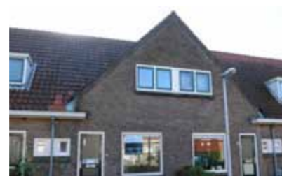
Hof van Colmschate 58 - Voorstad € 120.000,- k.k.