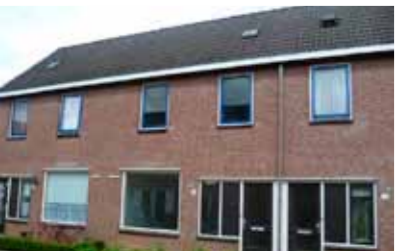
Kortelingenstraat 80 - Zandweerd € 153.000,- k.k.