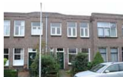
A.J. Duymaer v. Twiststr. 25 - nabij centrum € 167.500,- k.k.