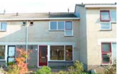
Kornolje 12 - 't Bramelt € 150.000,- k.k.