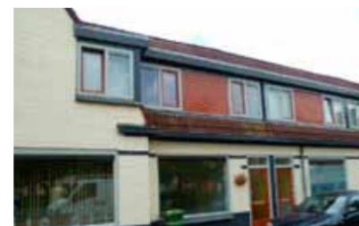
Gerhard ter Borchplein 3 - Zandweerd € 115.000,- k.k.