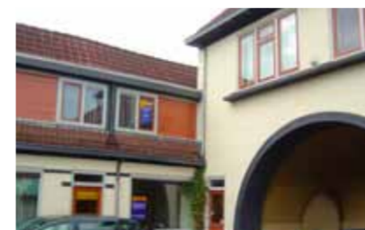
Gerhard ter Borchplein 8 - Zandweerd € 119.000,- k.k.