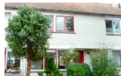
De Braam 123 - 't Bramelt € 162.500,- k.k.