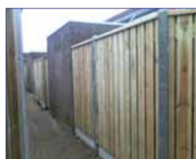
Nieuwe schuttingen voor bewoners van Zandweerd. De laatste werden eind 2011 geplaatst. Dat ziet er zo een stuk verzorgder uit.

In de buurt heeft lang niet iedereen de mogelijkheid om zelf naar de vuilstort te gaan, dus dat er nu containers stonden waar alle vuilnis in kon, bleek ideaal. Nu alles lekker schoon is, is het voor buurtbewoners gemakkelijker om alles bij te houden. Een geslaagde actie dus!