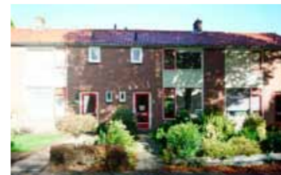
Ramelestraat 13 - de Bekkumer € 139.000,- k.k.