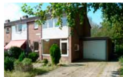
Geraniumstraat 2 - De Worp € 165.000,- k.k.