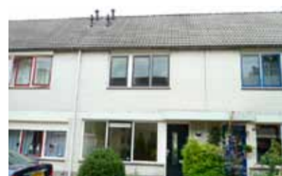
Gelderse Roos 14 - 't Bramelt € 165.000,- k.k.