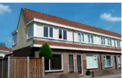
Burg. v. Marlestr. 19 - Burgemeesterwijk € 123.000,- k.k.