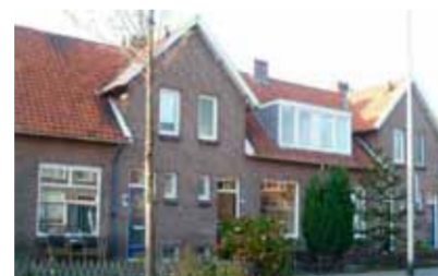
Diepenveenseweg 53 - nabij centrum € 118.500,- k.k.