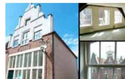
Papenstraat 85 - centrum € 139.000,- k.k.