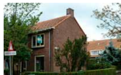
Oude Bathmenseweg 80 - Rivierenwijk € 155.000,- k.k.