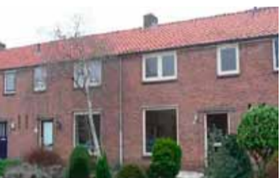
Van Ostadestraat 20 - Zandweerd € 135.000,- k.k.

Een huis kopen is best spannend. Om huurders antwoord te geven op die vragen organiseerde Rentree afgelopen jaar regelmatig koopavonden. Inderdaad: letterlijk kóópavonden. "Bezoekers konden financieel advies