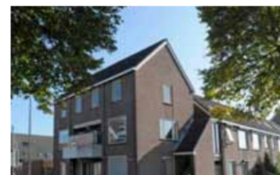
Ijsselkade 150 - nabij centrum € 139.000,- k.k.