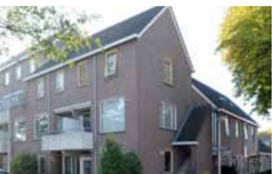
Lange Zandstraat 177a - nabij de IJssel € 102.500,- k.k.