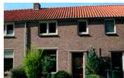
Ruysdaelstraat 44 - Zandweerd € 135.000,- k.k.