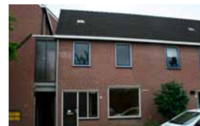
J.D. Huijbersstraat 1 - nabij de IJssel € 148.000,- k.k.